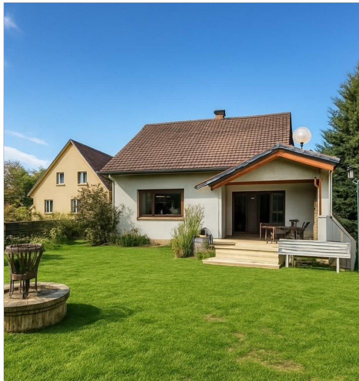
Blick vom Garten