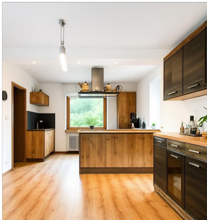
Küche v. der Terrasse