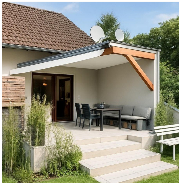
Blick v. Garten auf die Terrasse