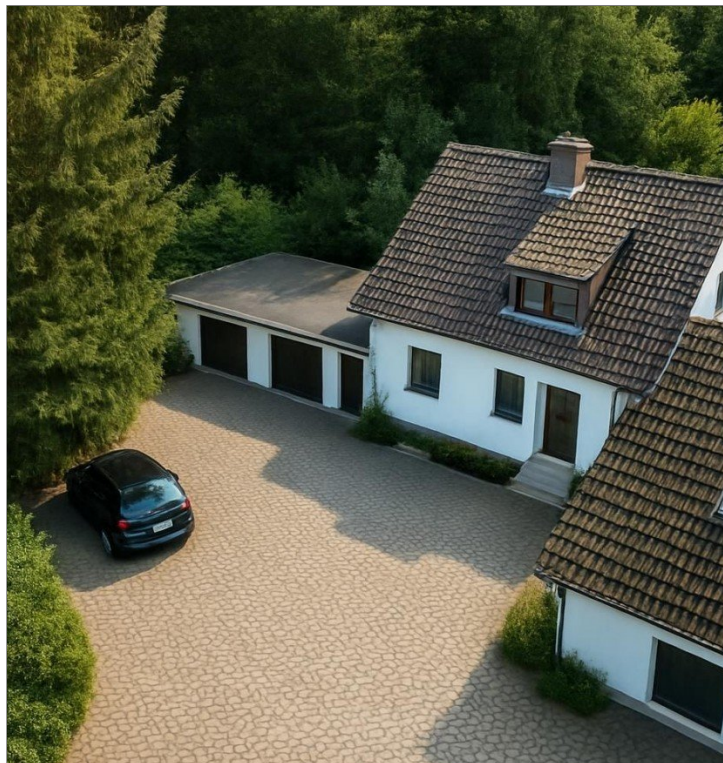
Draufsicht inkl. Garagen