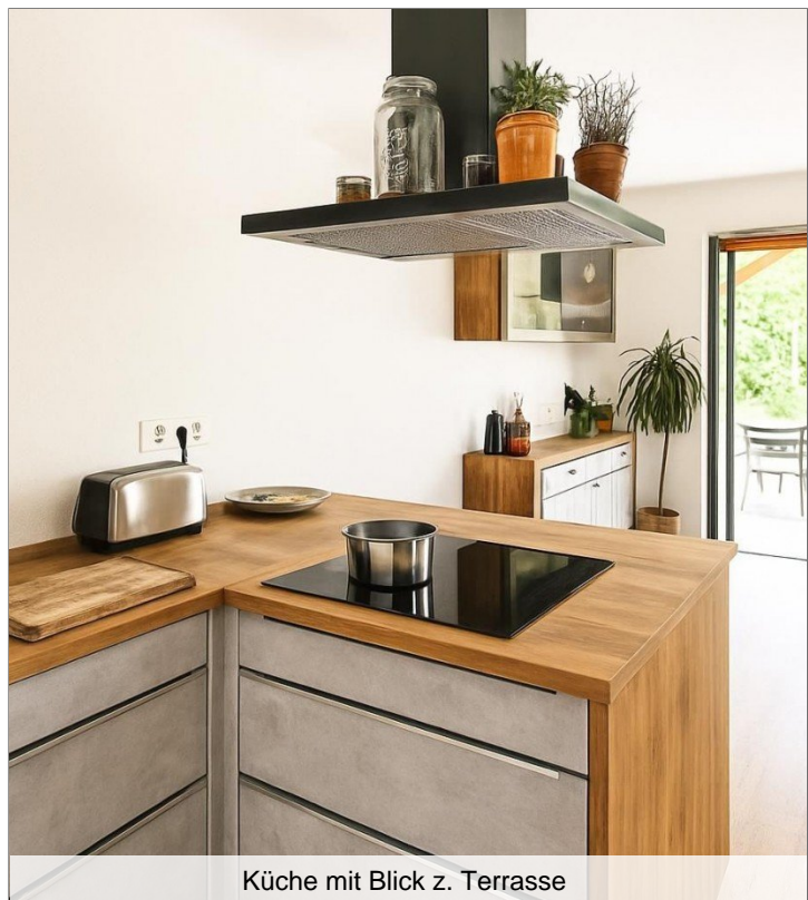
Küche mit Blick z. Terrasse