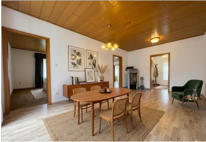
Wohn-/Esszimmer mit Kaminofen