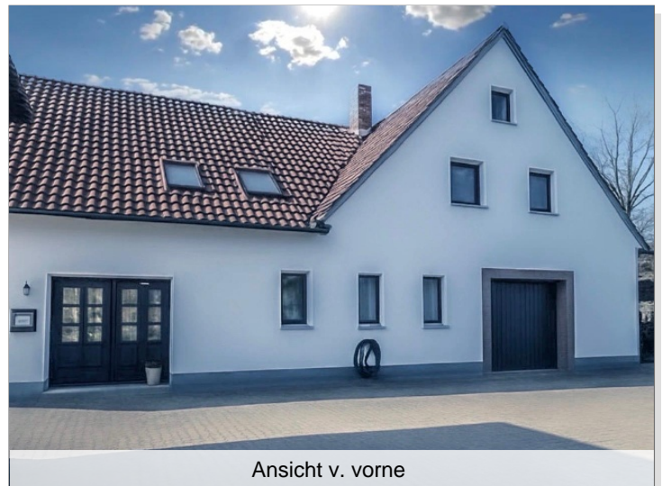
Ansicht v. vorne