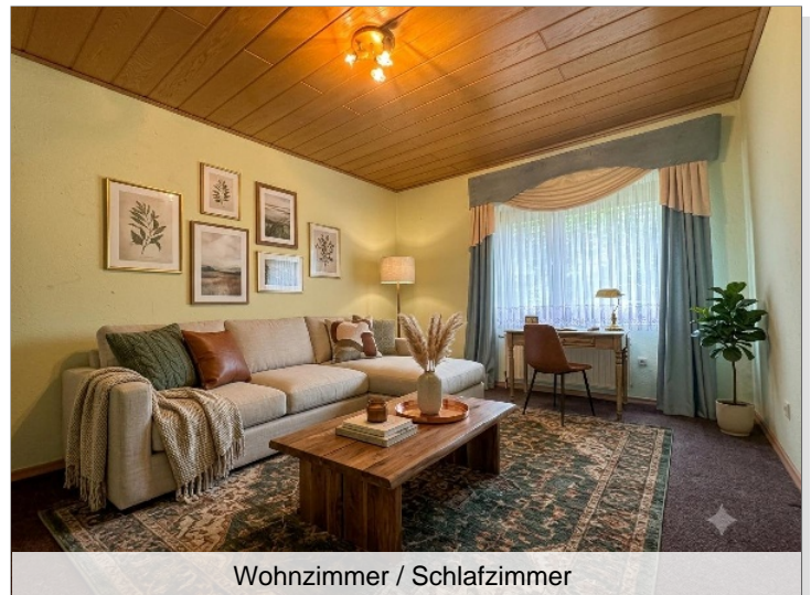
Wohnzimmer / Schlafzimmer